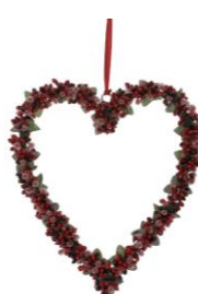
Srdce bobule, 15,99 €