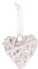
Prútené srdce, 1,49 €