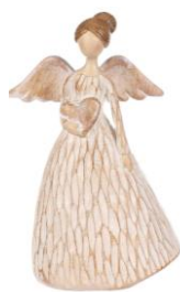
Anjel, 6,99 €