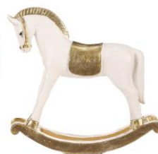
Hojdací koník, 9,99 €