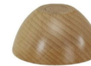
Dřevěné nohy bukové kulatý Z005