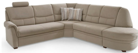
Design E +