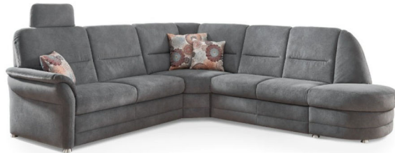
Design Q +