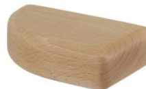
Dřevěné nohy bukové E009

Upozornění: Plochá dřevěná noha není u Design Q!