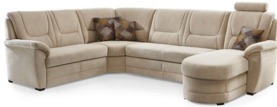
Design A +